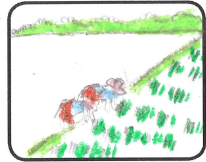
ชาวบ้านช่วยกันทำ นำต้นมาช่วยกันปลูกข้าว