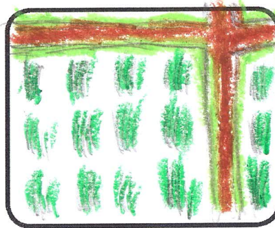
ทำหลุมเป็นแนวทั่ว ตัวเกิดเป็น ต้นกล้าก่อน