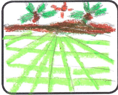
ทำช่องน้ำ ทุ่งนากว้างใหญ่ บนดินที่ฝนดินที่เตรียมไปทั่ว ต้นข้าว