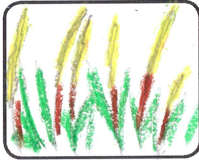
ต้นข้าวสูงแล้ว สีเขียว หรือสีนวล กลิ่นหอมฟุ้งไปทั่ว น่าน้ำ