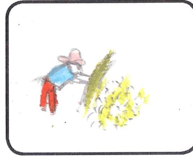
เมื่อได้ข้าวที่เกี่ยวแล้ว ก็เอาฟ่อนมาตี