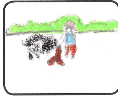
พรวนดินเป็นขั้นตอน วิธีที่คนเฒ่าปลูกข้าว