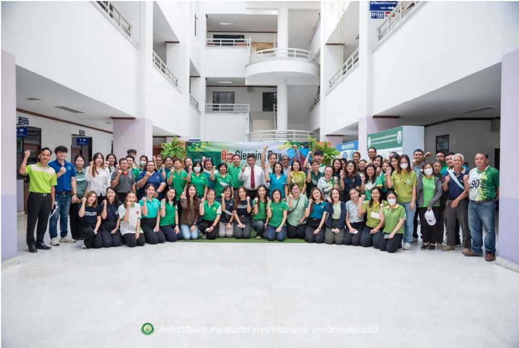
สำนักงานส่งเสริมวิสาหกิจชุมชน มหาวิทยาลัยแม่โจ้