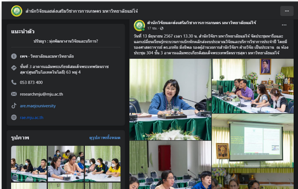
ประชาสัมพันธ์ใน Facebook

- ใช้ facebook ในการประชาสัมพันธ์ ข่าวสาร กิจกรรม ของสำนักวิจัยและส่งเสริมวิชาการ การเกษตร