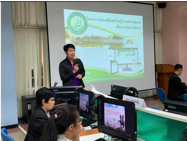
3 กันยายน 2562