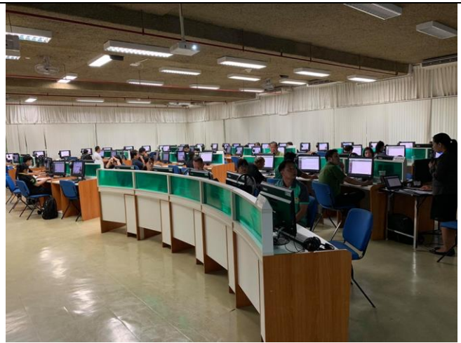
12 มิถุนายน 2562