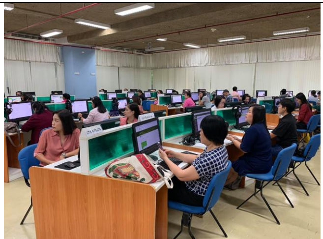
3 กันยายน 2562